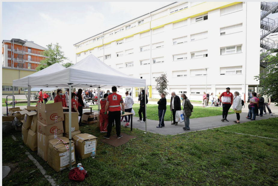
Podjela donacije donjeg rublja građanima smještenima u Cvjetnom naselju (2020.)

Objekti u vlasništvu Zagrebačkog Holdinga u kriznim su situacijama bili na raspolaganju za smještaj građana čiji su domovi stradali u potresu. Konkretno, za privremeni smještaj određeni su Studentski dom Cvjetno naselje i Hostel Arena. Skrb za osobe koje su bile u spomenutim privremenim smještajima pružao je GDCK Zagreb kroz usluge psihosocijalne pomoći i podrške, raspodjelu donacija hrane i higijenskih potrepština te prijevoz u zdravstvene i socijalne ustanove. U Cvjetnom naselju, starijim osobama koje nisu mogle doći do zajedničke blagovaonice dostavljana je hrana u sobu. Građanima u privremenom smještaju GDCK Zagreb dijelilo je i druge oblike humanitarne pomoći kao što su školski pribor i računala. Uz sve navedeno, djelatnici i volonteri GDCK Zagreb osobama u privremenom smještaju pružali su administrativnu podršku , kao što je prikuplja-