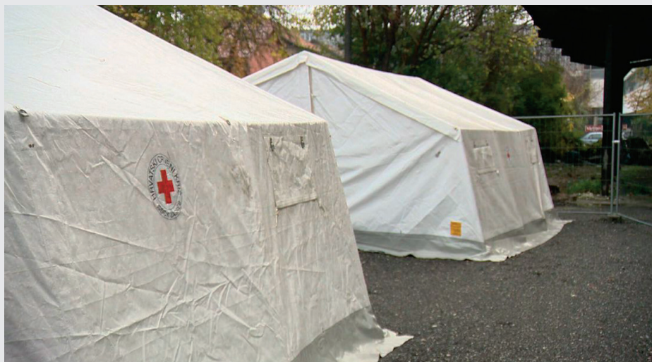
Šatori za migrante ispred Paromlina (2022.)

Djelatnici i volonteri GDCK Zagreb s državnim tijelima, kao što je Ravnateljstvo Civilne zaštite, radili su na prihvatu i registraciji osoba pri Službi traženja Crvenog križa. Također, GDCK Zagreb bio je zadužen i za podjelu humanitarne pomoći, informiranje korisnika i prijevoz onih slabije pokretnih na zdravstvene preglede.