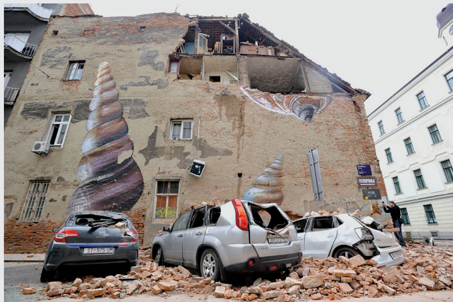
Centar Zagreba nakon potresa (2020.)

Nadalje, u razdoblju nakon potresa, s obzirom na tada vrlo aktualne epidemiološke mjere, teško je bilo pronaći smještaj za osobe koje su ostale bez krova nad glavom, osobito za žene koje nemaju prijavljeno prebivalište niti boravište u Gradu Zagrebu.