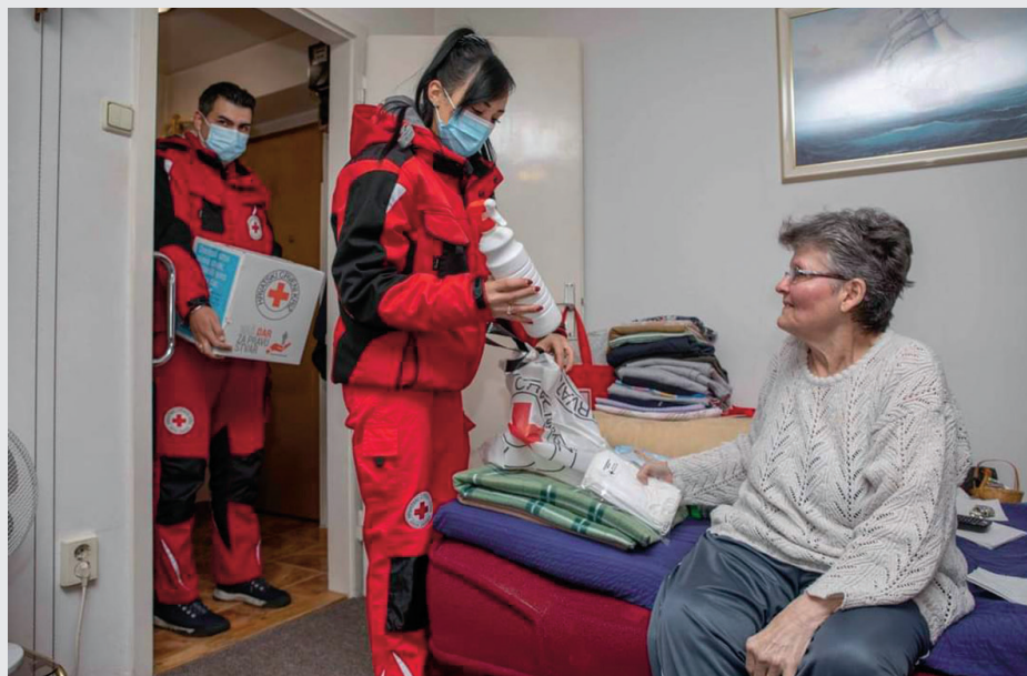
Posjet korisnici programa Pomoć u prehrani (2021.)

Kupnjom i dostavom namirnica i lijekova, volonteri GDCK Zagreb pružali su po- moć nemoćnim i kronično bolesnim osobama koje su bile u najvećem riziku od zaraze virusom SARS-CoV-2. Građani u potrebi telefonski su se javljali za ovakav oblik usluge.