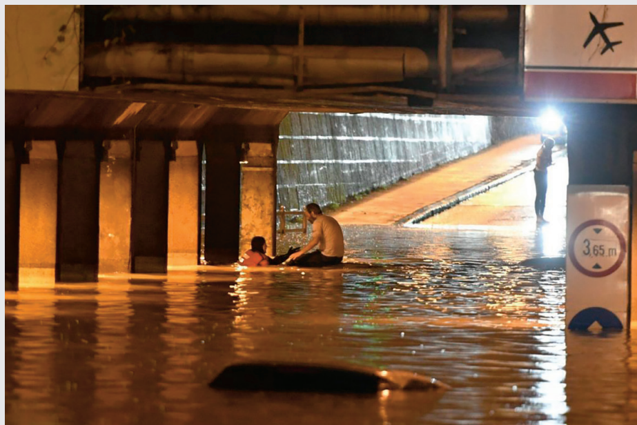
Urbane poplave u Zagrebu (2020.)

Zimsko razdoblje, odnosno razdoblje ekstremnih zima, za beskućnike je krizno te im je prijeko potreban smještaj s osiguranim grijanjem, pogotovo u noćnim satima.