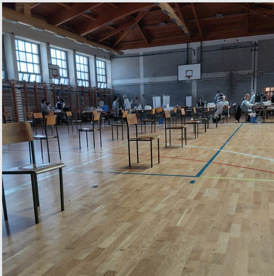
Punkt za cijepljenje u Gimnaziji Lucijana Vranjanina (2021.)

Osim pravovremenog informiranja nadležnih službi, Gradski ured za socijalnu zaštitu, zdravstvo, branitelje i osobe s invaliditetom bio je odgovoran i za nabavu brzih SARS-CoV-2 Antigen testova za samotestiranje za sve socijalne i zdravstvene ustanove kojima je osnivač Grad Zagreb, dok je Gradski ured za obrazovanje, sport i mlade dostavljao obavijesti školama – upute kako testirati i gdje preuzeti nabavljene testove. GDCK Zagreb bio je zadužen za pripremu i distribuciju testova .