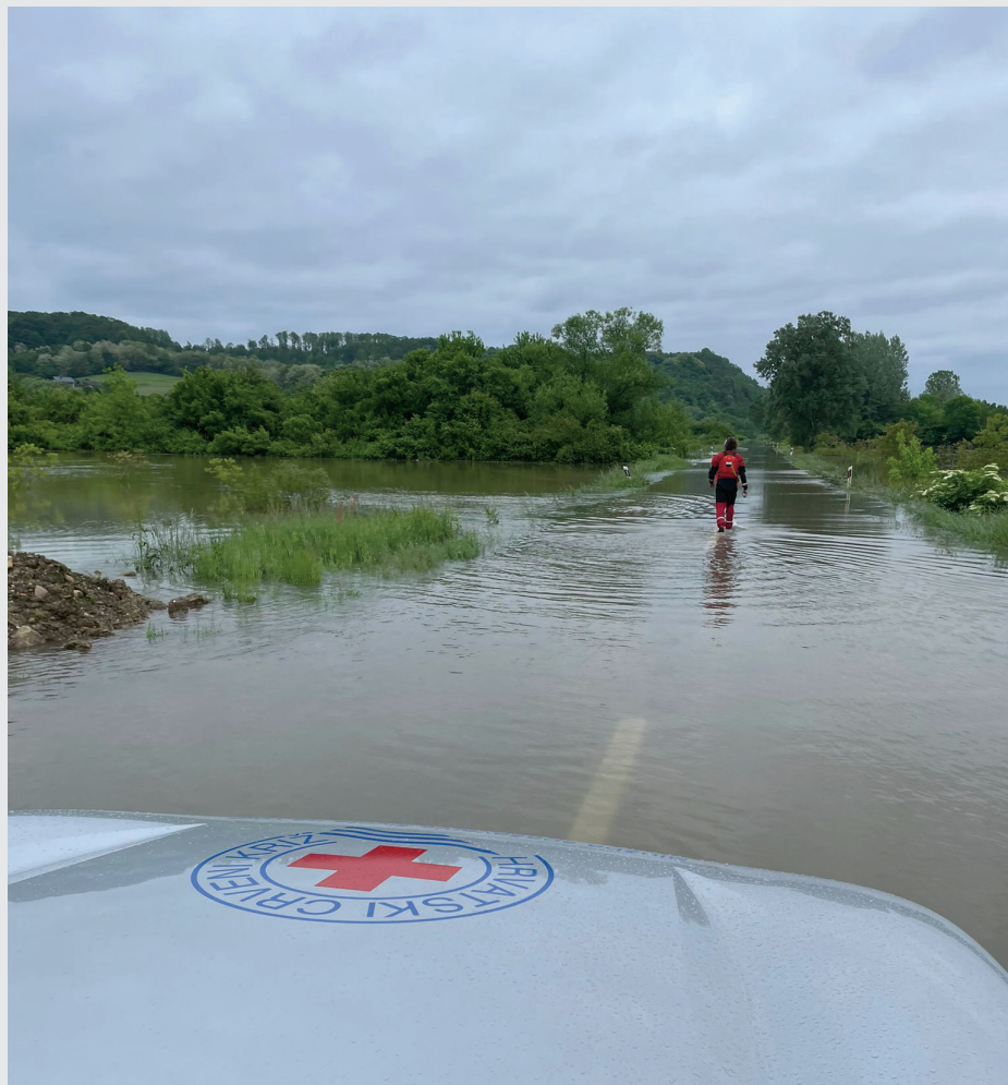
Interventni tim GDCK Zagreb na području pogodnom poplavom (2023.)

Za beskućnice i beskućnike koji ne žele smještaj u prihvatilištima u zimskim razdobljima te ostaju na ulici ili u neadekvatnim nastambama i objektima, GDCK Zagreb nudi pomoć osiguravanjem pokrivača i vreća za spavanje.