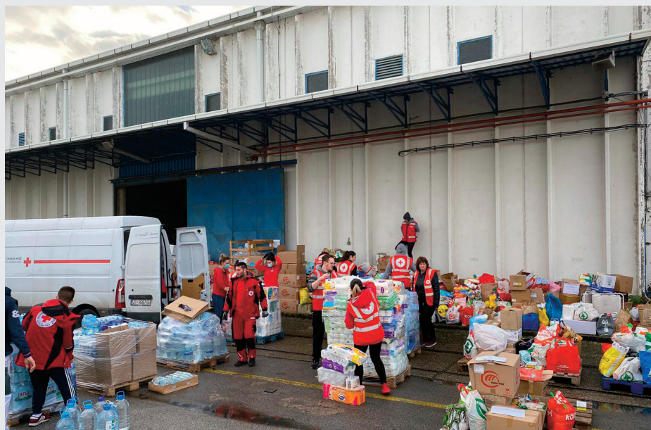
Zaprimanje i provjera humanitarne pomoći (2020.)

Interventna služba Hrvatskog Centra za Potresno inženjerstvo (HCPI-IS) također je na raspolaganju građanima u situacijama velikih prirodnih nepogoda i uopće velikih katastrofa uslijed kojih dolazi do oštećenja većeg broja građevina te je potreban brzi izlazak inženjera koji će stručno pregledati građevine i dati brzu ocjenu stanja njihove uporabljivosti.